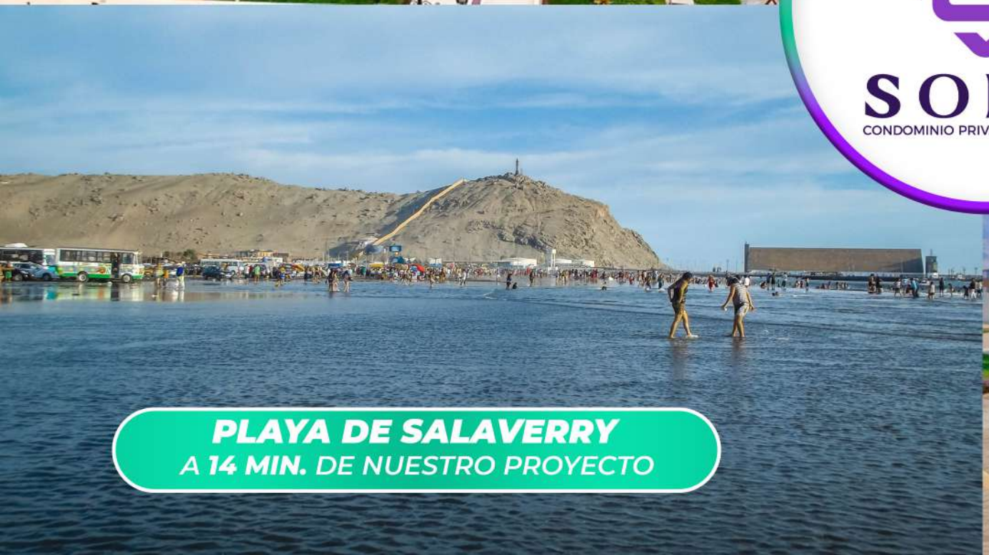
PLAYA DE SALAVERRY A 14 MIN. DE NUESTRO PROYECTO