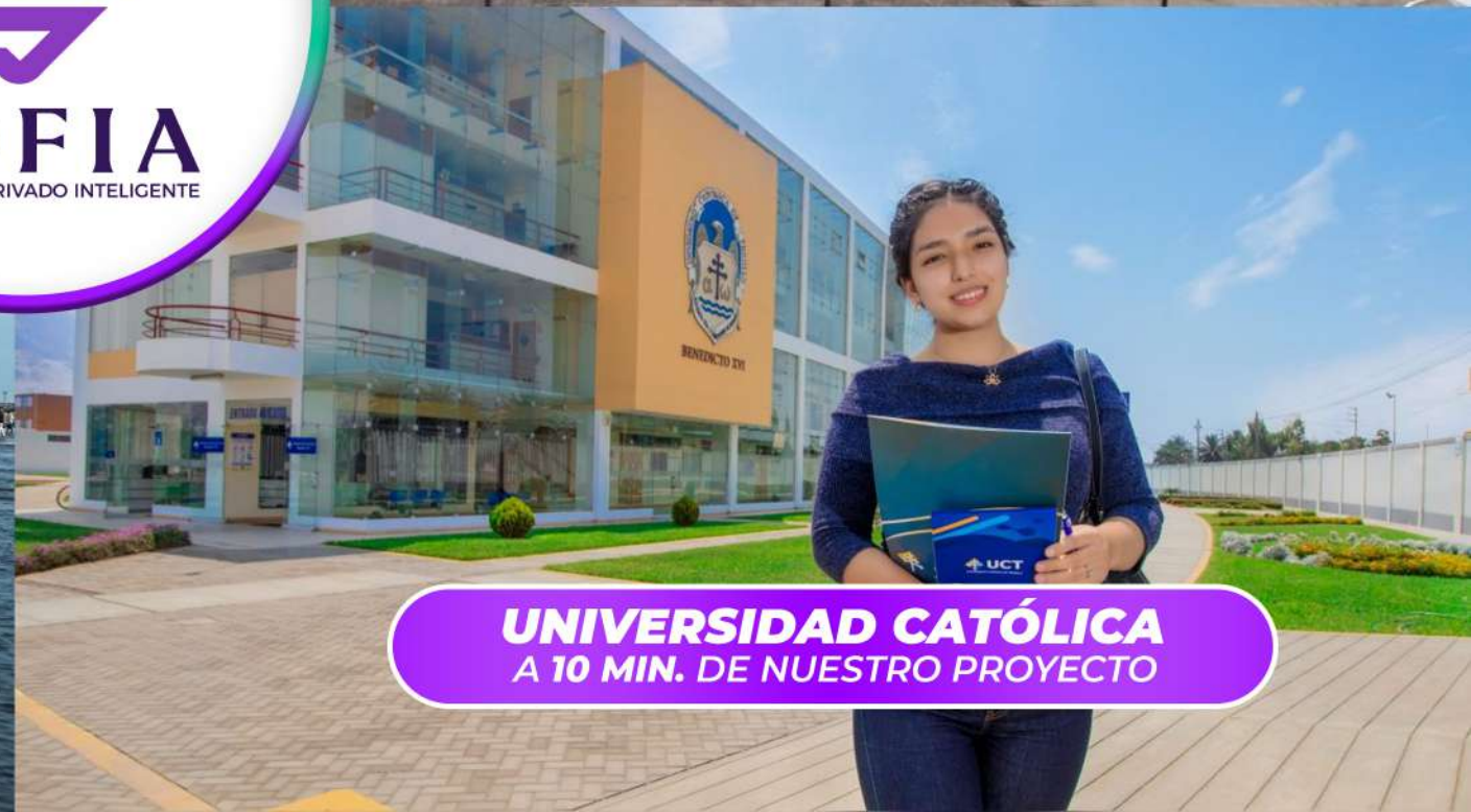
UNIVERSIDAD CATÓLICA A 10 MIN. DE NUESTRO PROYECTO