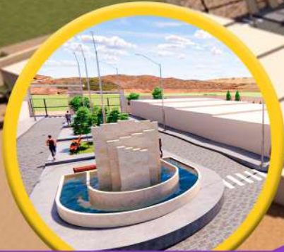
Parques y Alamedas