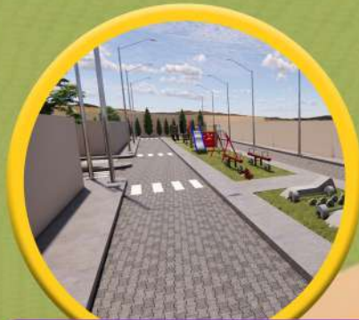
Pistas y Veredas