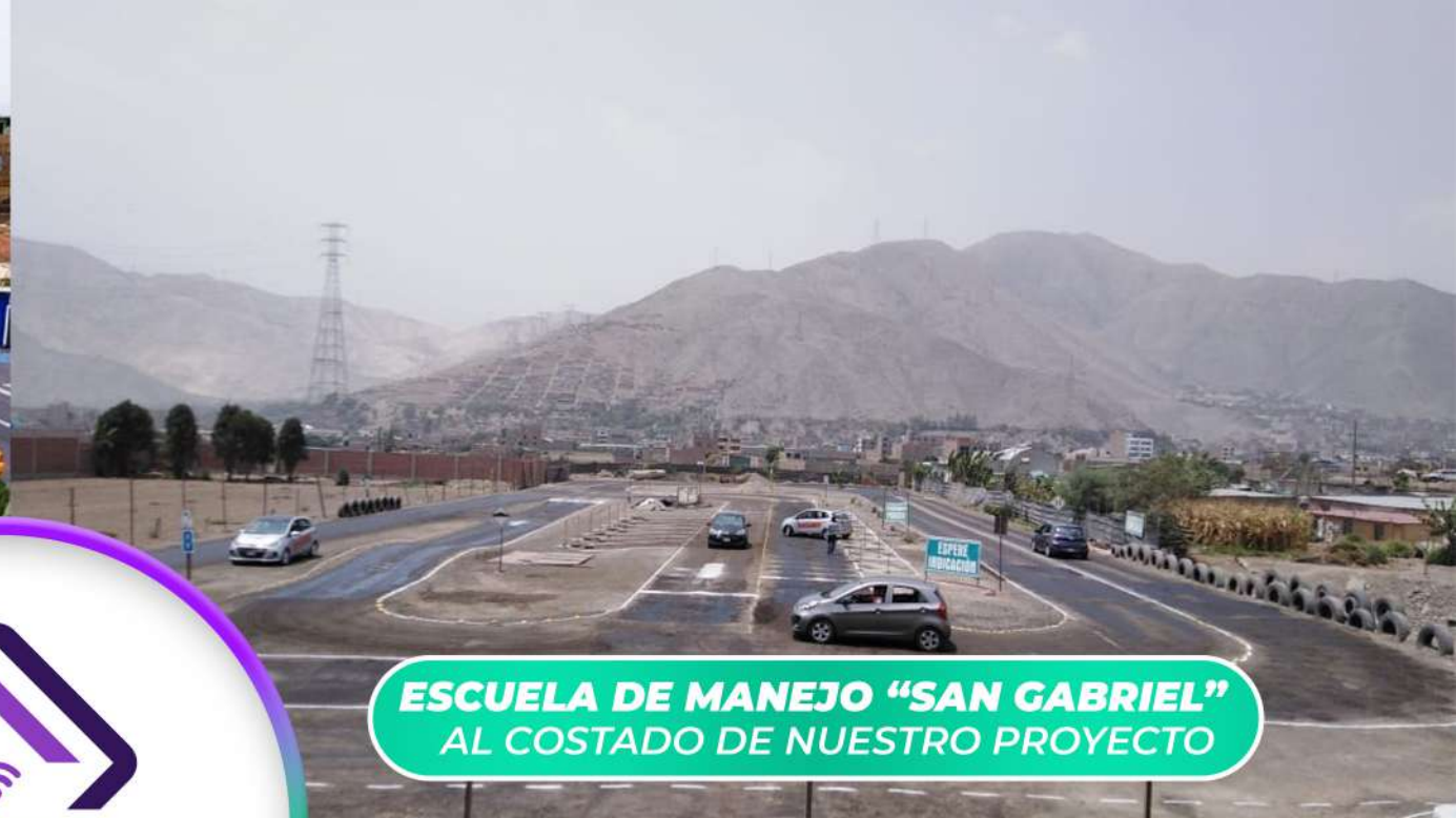
ESCUELA DE MANEJO "SAN GABRIEL" AL COSTADO DE NUESTRO PROYECTO