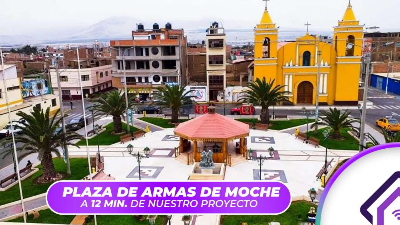
PLAZA DE ARMAS DE MOCHE A 12 MIN. DE NUESTRO PROYECTO