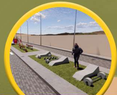
Área de Gimnasio