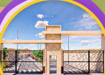
Pórtico de Ingreso